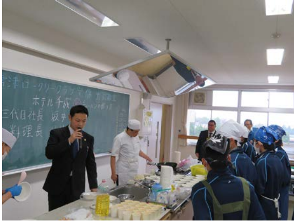
⑨チャーハンの作り方