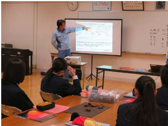
知ってそうで知らない？鉄のすごさ！