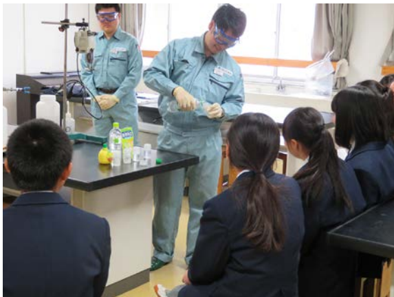
水をきれいにする仕事