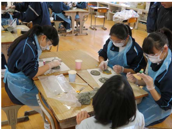
製鉄所内のエコな仕事