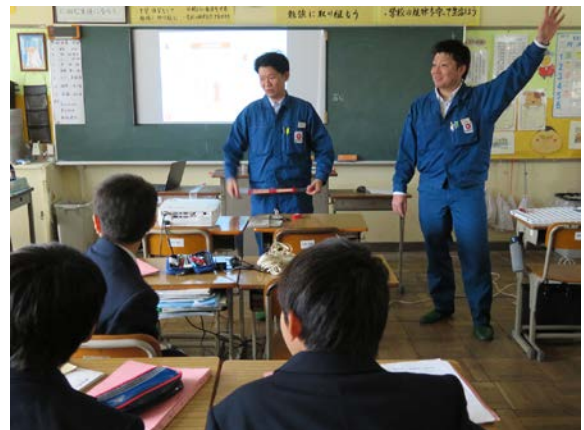
電気をつくる仕事