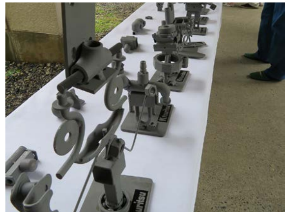
溶接でスクラップロボをつくる